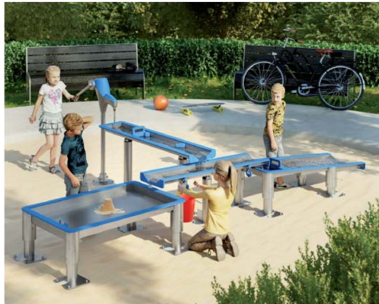
LOTE AGUA 2 WATER SET 2 KIT AQUATIQUE 2