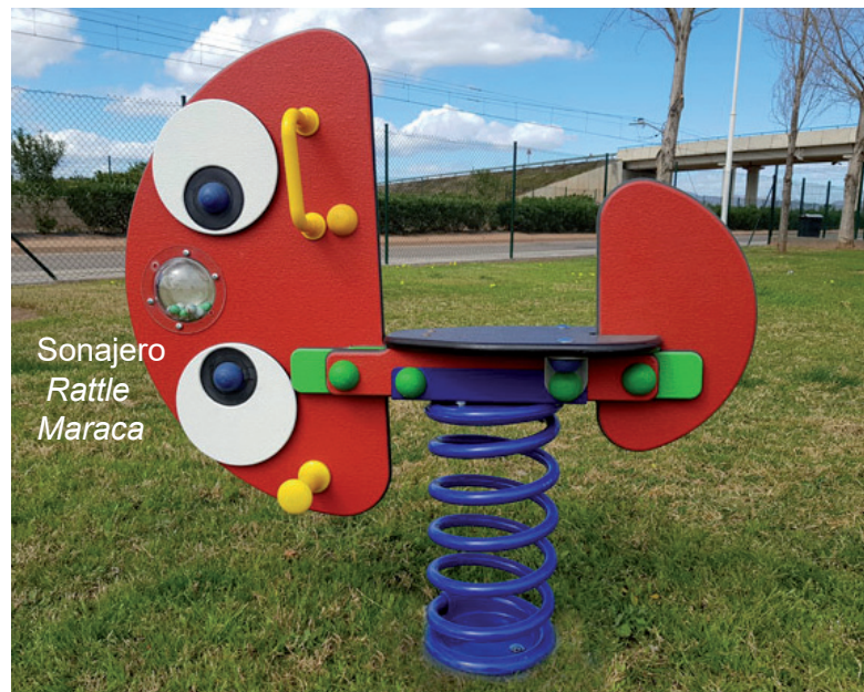
Sonajero Rattle Maraca